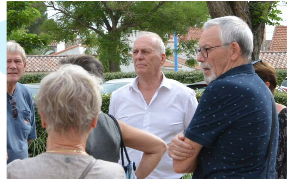
Le Maire avec les Berrois.