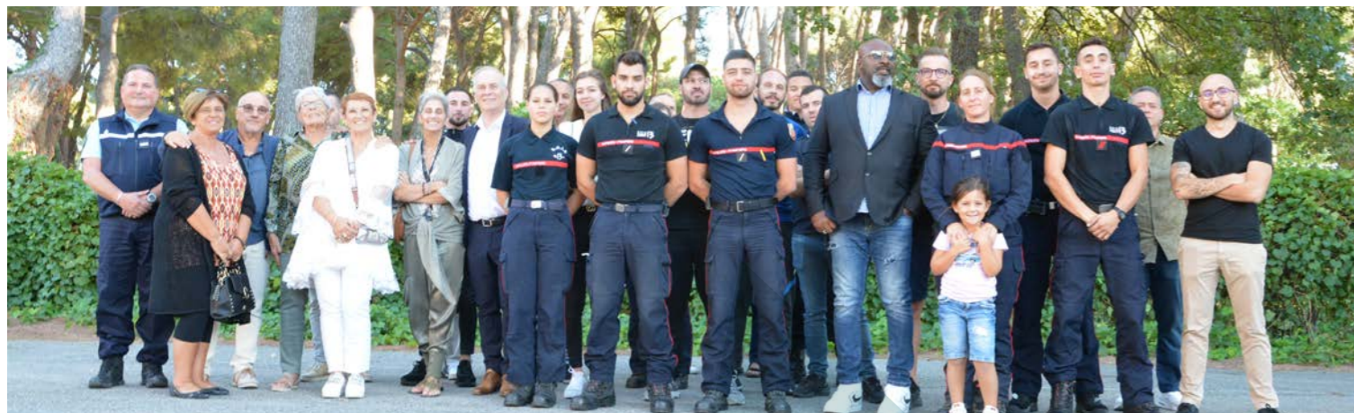
Le Maire a tenu à remercier les pompiers au nom de la municipalité et de l'ensemble des Berrois.