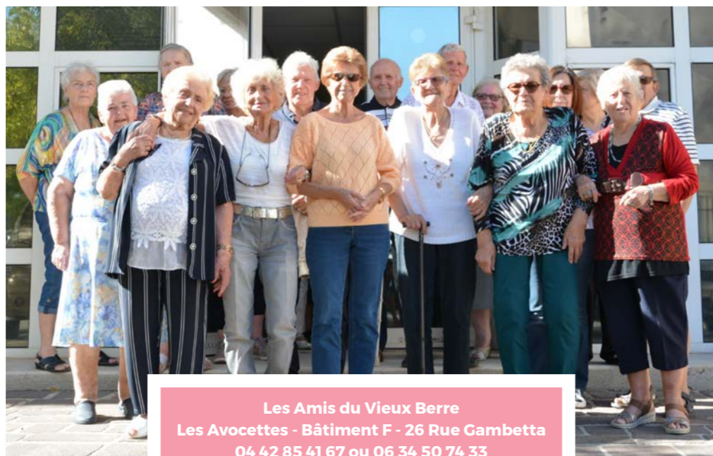
Les Amis du Vieux Berre Les Avocettes - Bâtiment F - 26 Rue Gambetta 04 42 85 41 67 ou 06 34 50 74 33