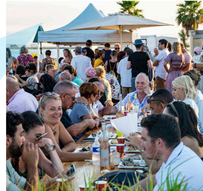
Le Maire avec les Berrois