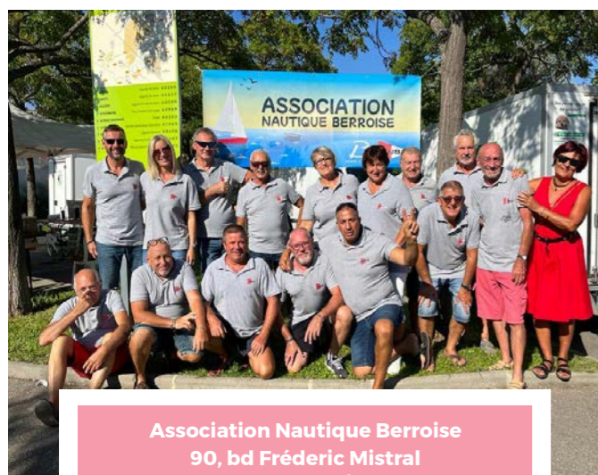
Association Nautique Berroise 90, bd Frédéric Mistral 13130 Berre l'Étang 06 07 53 90 55 a-n-b@orange.fr