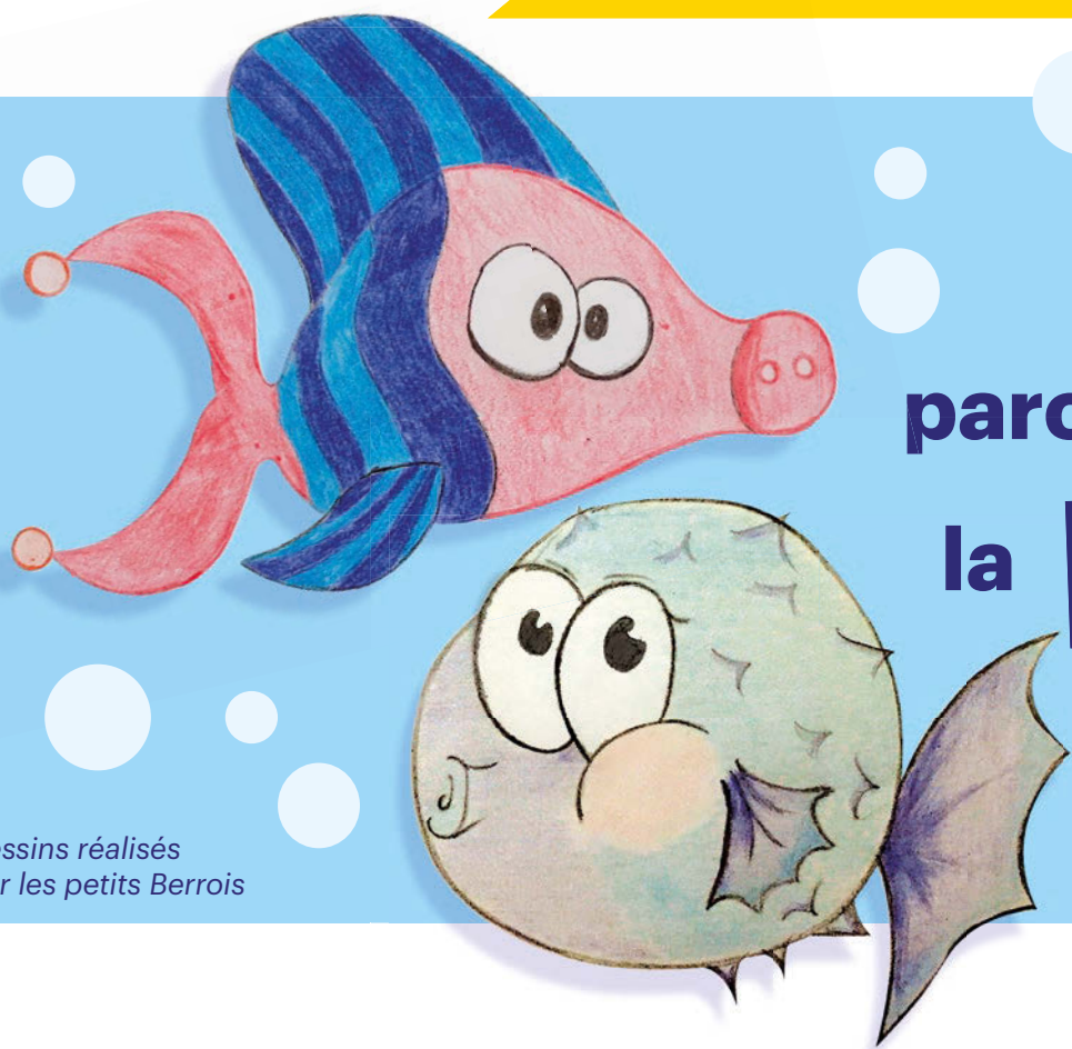
Dessins réalisés par les petits Berrois

A Berre, des poissons d'avril, parce qu'on ne plaisante pas avec la protection de notre étang !